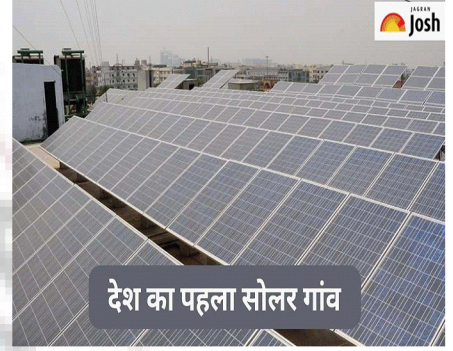
देश का पहला सोलर गांव

(A) हाल ही में महाराष्ट्र के मुख्यमंत्री एकनाथ शिंदे ने राज्य के पहले सौर गांव का उद्घाटन किया। सतारा जिले के पाटन तालुका में मन्याचीवाड़ी गांव महाराष्ट्र का पहला सौर गांव बन गया है। मुख्यमंत्री एकनाथ शिंदे ने कहा कि राज्य सरकार अक्षय ऊर्जा के उपयोग को बढ़ावा देने और पारंपरिक ऊर्जा स्रोतों पर निर्भरता कम करने के लिए प्रतिबद्ध है।